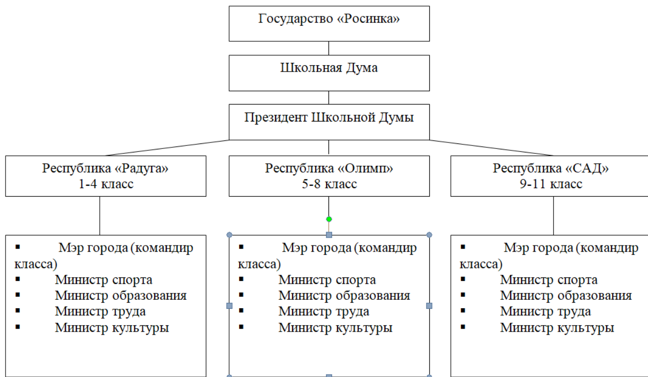
Схема самоуправления в МОУ «Дзякинская СОШ»

Вся воспитательная работа в начальном звене проводилась в рамках детского объединения «Радуга» (1-4 кл.), в среднем звене «Олимп» (5-7 кл.) и старшем звене «САД» (8-11 кл.). Работа по данному направлению проводилась в рамках сложившейся системы. Ежегодно силами Школьной Думы проводится праздник Чести школы, на котором подводятся итоги работы объединения «Государство «Росинка» за год, награждение обучающихся и классов. Стало традицией в октябре проводить День самоуправления. Работа в органах ученического самоуправления способствует становлению личности учащихся, формирует активную гражданскую позицию и самосознание гражданина РФ.