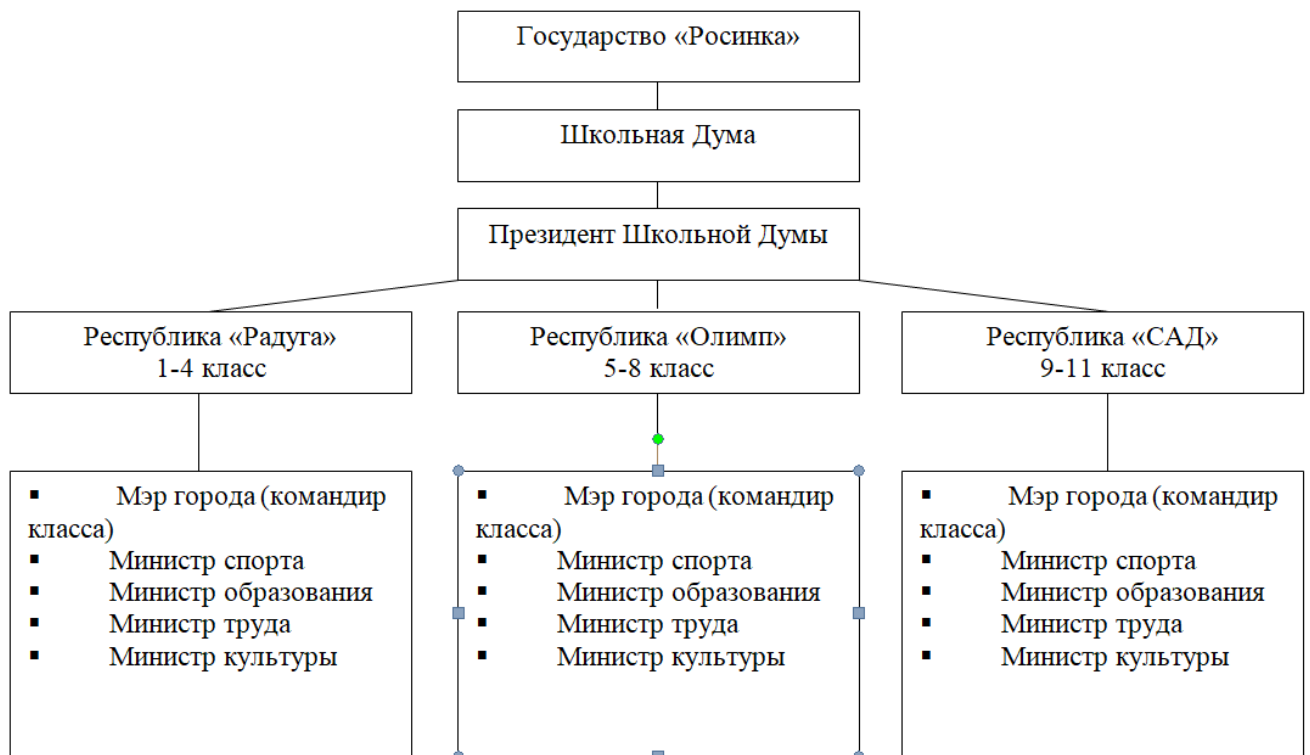
Схема самоуправления в МОУ «Дзякинская СОШ»

Вся воспитательная работа в начальном звене проводилась в рамках детского объединения «Радуга» (1-4 кл.), в среднем звене «Олимп» (5-7 кл.) и старшем звене «САД» (8-11 кл.). Работа по данному направлению проводилась в рамках сложившейся системы. Ежегодно силами Школьной Думы проводится праздник Чести школы, на котором подводятся итоги работы объединения «Государство «Росинка» за год, награждение обучающихся и классов. Стало традицией в октябре проводить День самоуправления. Работа в органах ученического самоуправления способствует становлению личности учащихся, формирует активную гражданскую позицию и самосознание гражданина РФ.